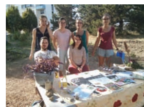
Figure 3: L'équipe «Urba Green», au cours d'une soirée d'animation, au jardin du Mini M.

• Le projet tutoré "Urba Green" : Le projet tutoré est un dispositif pédagogique de l'INP-ENSAT 1 : sur une durée scolaire totale d'environ trois semaines, réparties d'octobre 2016 à janvier 2017, une équipe de six élèves ingénieurs agronomes 1 nommée « Urba Green » a été encadrée par A.Thouvenin et G.Bertoni (Figure 3).