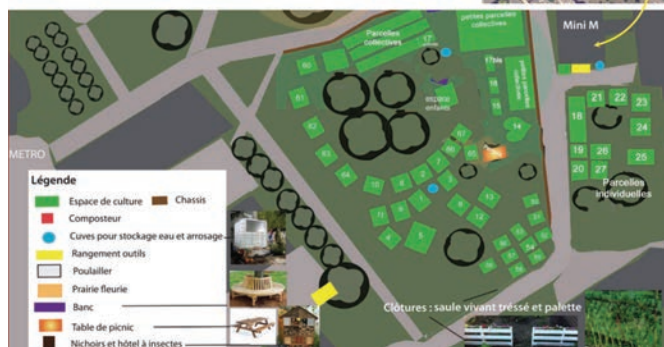
Figure 1: Environnement (Géoportail, 2015) et plan du jardin du Mini M en 2017.