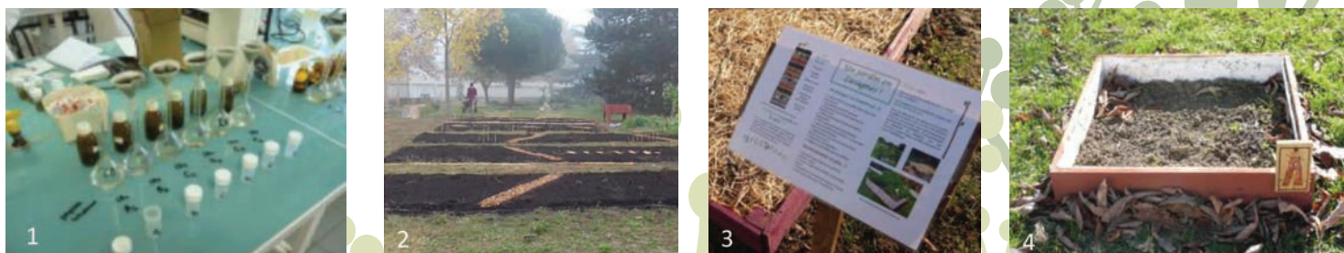
Figure 4 : Les axes de travail du projet tutoré « Urba Green » : 1- Documenter les caractéristiques du sol, avec des méthodes simples et peu coûteuses. 2- Créer des supports pédagogiques et partager des savoirs agronomiques. 3- Aménager la partie collective du jardin du Mini M. 4- Créer des parcelles expérimentales pédagogiques.

• « Urba Green » a développé une animation autour d'une meilleure connaissance de l'écosystème sol, d'un projet d'aménagement de la partie collective du jardin et d'une pédagogie des pratiques agroécologiques (Figure 4).