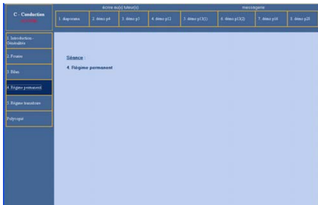
Figure 4 : Documents du cours de conduction dans les solides