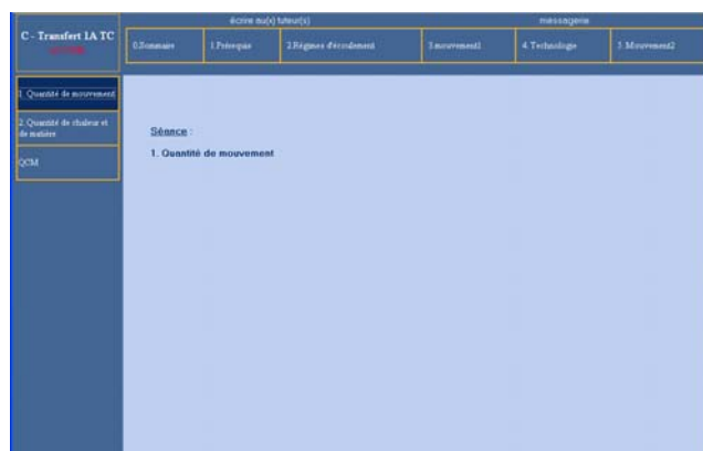
Figure 1 : Mise à disposition des documents de transferts sur la plateforme de téléenseignement

(environ 200 étudiants). L'enseignant, ayant déjà enseigné de manière traditionnelle dans le domaine, est confronté à une population d'étudiants délicate car n'ayant pas les mêmes centres d'intérêt, ne se connaissant pas, n'ayant pas l'habitude de travailler en groupe, ayant des cursus très différents, ne disposant encore pas d'ordinateur personnel pour environ la moitié d'entre eux mais ayant accès à des salles d'ordinateurs au sein de l'établissement. Il s'agit alors de convaincre une majorité d'étudiants qui appréhendent difficilement cet enseignement en présentiel. L'enseignement est proposé sur une plateforme de téléenseignement sous la forme d'un diaporama POWERPOINT plus ou moins animé selon le contenu des chapitres (ceux contenant majoritairement des équations sont peu animés, alors que ceux contenant des schémas le sont davantage), et comprenant sous forme écrite tous les commentaires qui seraient proposés oralement aux étudiants en présentiel (figure 1). Plus de 7000 connections ont été comptabilisées en 2005-2006.