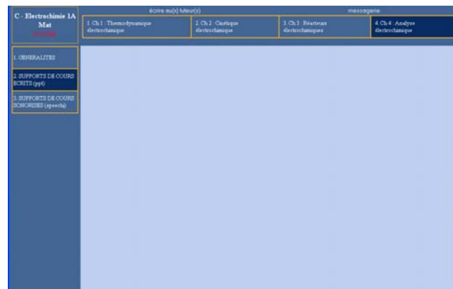
Figure 2 : Supports du cours d'électrochimie mis à la disposition des étudiants

L'intérêt principal de ce mode d'enseignement réside dans sa grande souplesse d'utilisation, permettant une grande adaptabilité à l'hétérogénéité des cursus étudiants. La vitesse d'acquisition des connaissances est ajustée par l'apprenant lui-même en fonction de son niveau et de ses capacités d'assimilation, en se référant aux objectifs fixés par l'enseignant. Ainsi les pré-requis peuvent être survolés ou révisés plus en détails, les explications sur les notions plus complexes peuvent être relues ou réentendues le nombre de fois requis pour accéder à un bon niveau de compréhension. L'étudiant est acteur de sa formation, l'apprentissage est recentré sur l'apprenant tout en créant une dynamique au sein du groupe d'étudiants. De nombreuses questions sur les exercices dont seules les solutions numériques ont été fournies ont été posées par les étudiants en dehors des créneaux horaires d'enseignement banalisés à l'emploi du temps, un millier de connections à la plateforme a été enregistré, attestant l'investissement des étudiants dans le module enseigné.