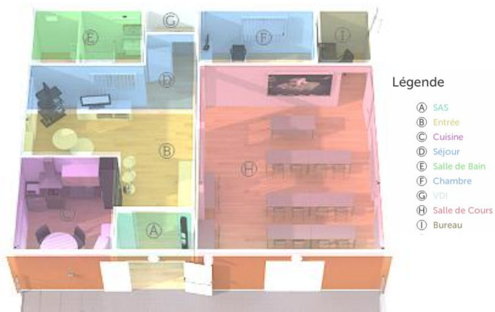
Figure 2 . Maison intelligente de l'IUT Blagnac

Pour ce faire, dans la configuration standard, l'appartement est équipé d'une infrastructure interconnectée adaptable à une personne valide, à une personne âgée, à une personne handicapée. Pour cela, il est équipé de diverses sortes de capteurs (confort, sécurité domestique, gestion des accès, téléassistance,...) et d'aides techniques [4].