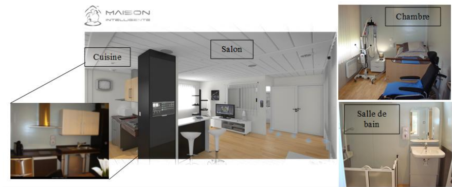
Figure 3 . Maison intelligente domotisée

La maison possède une superficie de 80m 2 avec plusieurs pièces de vie et un local de 40m 2 destiné à la formation pédagogique, aux rencontres scientifiques et aux réunions avec les partenaires industriels (Figure 3). Elle est domotisée et aménagée pour recevoir un usager vivant seul, en perte d'autonomie ou handicapé [4]. Cette installation « intelligemment connectée » permet un confort de vie amélioré qui peut ainsi être géré selon des séquences pré-établies. Par exemple, une action effectuée sur un bouton de la télécommande ou un interrupteur peut enclencher à la fois l'ouverture d'une porte, l'éclairage d'une salle ou d'une zone et l'ouverture des volets. Une action sur un bouton « départ du domicile » peut correspondre à la mise en mode économique du chauffage, à la fermeture des occultants et à l'extinction de toutes les lumières... Chaque séquence programmée est personnalisée selon le profil et les souhaits de l'individu.