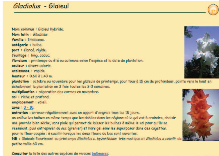
FIGURE 3 – Une fiche du site web http://nature.jardin.free.fr

textuelle est conforme à la représentation sémantique de la figure 2 : <nom latin> est retenu comme champ identifiant l'entité décrite dans chaque page; <nom commun>, <catégorie>, <feuillage>, etc. sont des élaborations de <nom latin> et fournissent des propriétés de cette entité. Sur la figure 3, le concept Gladiolus est défini par des relations avec d'autres concepts : Gladiolus aCatégorie bulbe, Gladiolus fleuritEn printemps, Gladiolus aForme-Feuillage long, etc. ; ou par des propriétés avec des valeurs : Gladiolus aHauteur « 0.60-1.40 », Gladiolus aNomCommun « Glaïeul hybride », etc. Lorsque le contenu d'un champ est une liste de syntagmes, soit la même relation est distribuée sur tous les items de la liste (e.g. fleuritEn dans <floraison>), soit plusieurs relations spécifiques s'appliquent sur ces items (e.g. <feuillage> contient des informations sur la forme et sur la persistance du feuillage, ce qui conduit à définir deux types de relations : aFormeFeuillage et aPersistanceFeuillage).