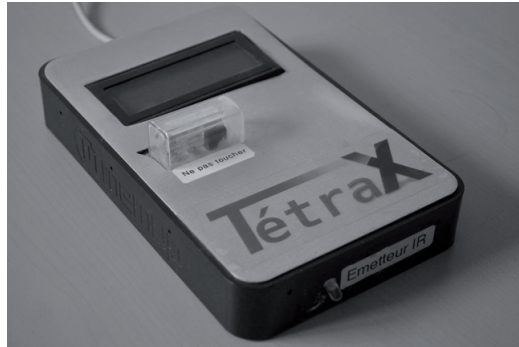
Figure 2 : Partie matérielle de TetraX à bas d'arduino