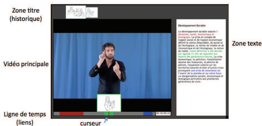
Figure 1. document hypersigne

Il faut donc définir un procédé pour visualiser les segments (ici temporels) du document qui sont activables, indiquer le thème de la cible du lien, suivre effectivement le lien, afficher le document cible, puis soit poursuivre en suivant d'autres liens soit revenir au document initial via une fonction retour ou via un historique. Contrairement au document écrit, on ne peut pas indiquer un lien par une information visuelle dans le document vidéo, puisqu'aussitôt après avoir été perçu il ne serait plus accessible. Il faut donc dissocier l'indication des segments temporels cliquables de l'affichage de la vidéo elle-même. Pour cela nous avons réalisé un lecteur spécifique (figure 1).